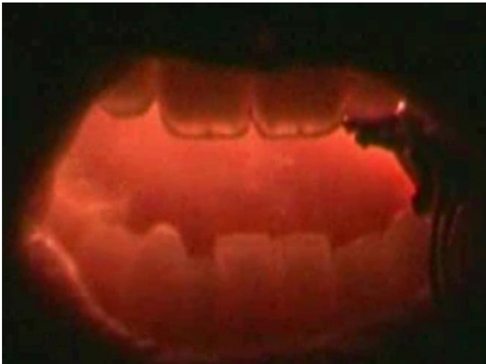
Spectacle Le Verbe - Cie iatus - 2004 - d'après le texte Le Verbe de Ghérasim Luca