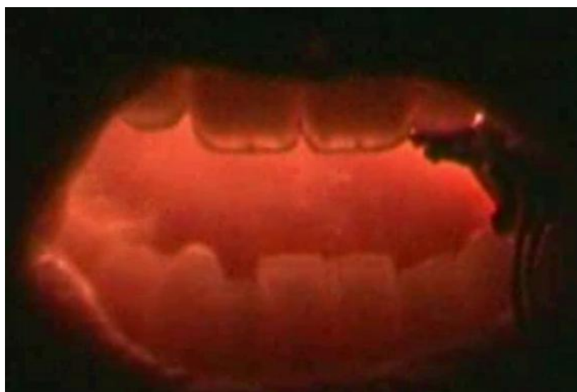
Spectacle Le Verbe - Cie iatus - 2004 - d'après le texte Le Verbe de Gherasin Luca