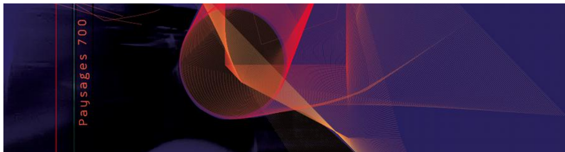
CD Paysages 700 - sortie 2016

Il y a enfin dans ce projet une certaine dimension morale, une dimension d'apaisement, de maturation : de pardon. A l'inverse de cette expression d'« avoir la dent dure », c'est à dire de ne pas pardonner, de ne pas oublier, rester sur la colère et la récrimination, passer ici à l'attitude de la « la dent douce », c'est à dire laisser passer les aspérités de la vie et aller vers un apaisement. Avec un peu d'humour on pourrait même dire : aller vers un « aéropolissage ». Si la dent est dure, elle peut-être très douce à l'écoute, et musicienne.... »