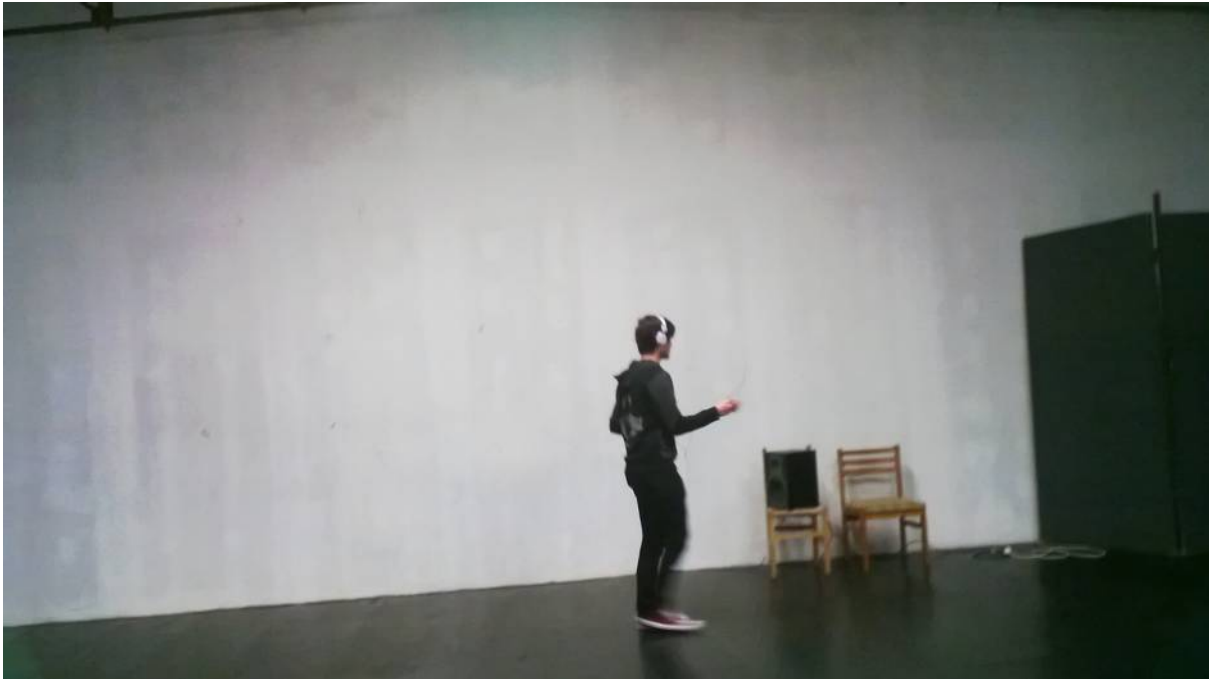
Atelier sonore au Ring - 2014