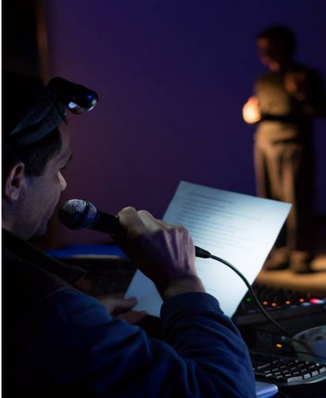
Spectacle Les Lumières – décembre 2015

Le projet de mise en scène de Conglomérat de Pommes Particules se situe entre une lecture théâtralisée et une mise en scène simple.