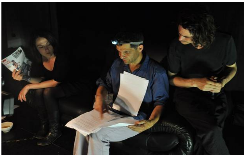
Tournage Le Rubbant – juillet 2013

L'idée de cette lecture théâtralisée est permettre au spectateur de dériver à l'écoute du texte, entre les particules de mots, à l'intérieur de ce conglomérat de pommes particules , pour faire son propre chemin de poésie.